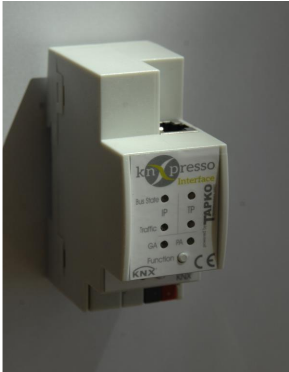
knXpresso IP Interface

Sollen mehr als 4 Tablets/Phones in einem Projekt verwendet werden, so müssen entsprechend viele IP Interfaces installiert werden.